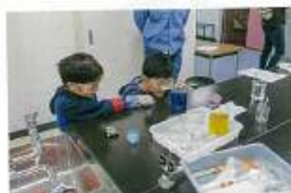
化学反応はおもしろい！