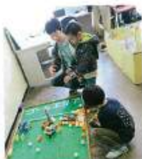
なかなかうまく拾えない

開催日 平成29年11月11日・12日 場所 静岡大学浜松キャンパス内 当日は第22回テクノフェスタin浜松と第18回静大祭in浜松が開催されました