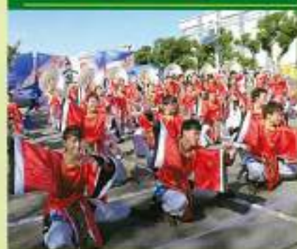
浜松学生連 鰻陀羅