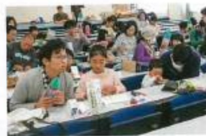
水ロケットできました。