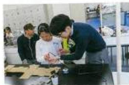
ハンダ付けは難しい