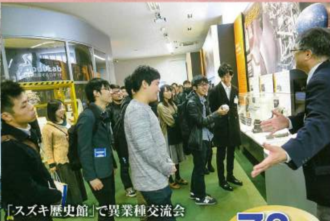
「スズキ歴史館」で異業種交流会