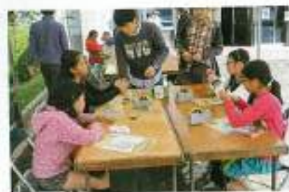
スタンドグラスの製作です。