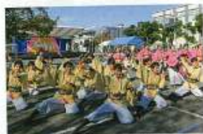
浜松学生連 観陀羅の演舞