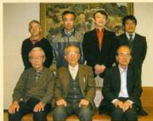
Uターン相談室スタッフ

Uターン相談室は、浜松工業会会員(以下会員)で主に県外から県西部地域にUターンして、再就職を希望される方々を対象に、信頼ある地元企業への再就職の相談窓口として、長年活動を続けております。