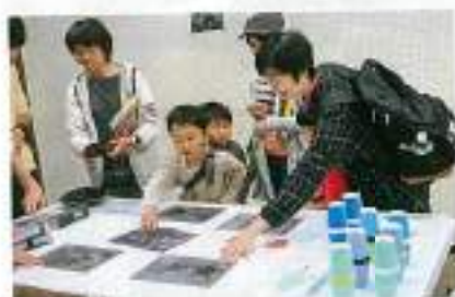
模様が動いて見えるよ