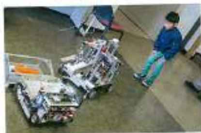
これはロボットかな？