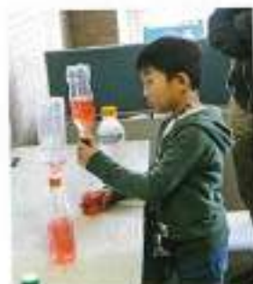
これどうなってるのかな