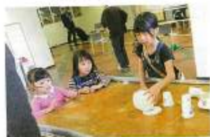
これはどうやって使うの？