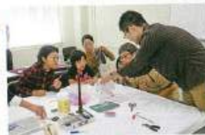
この色みてください