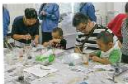
きれいに描けたかな