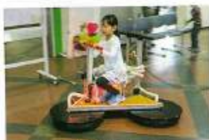
これ速くておもしろい