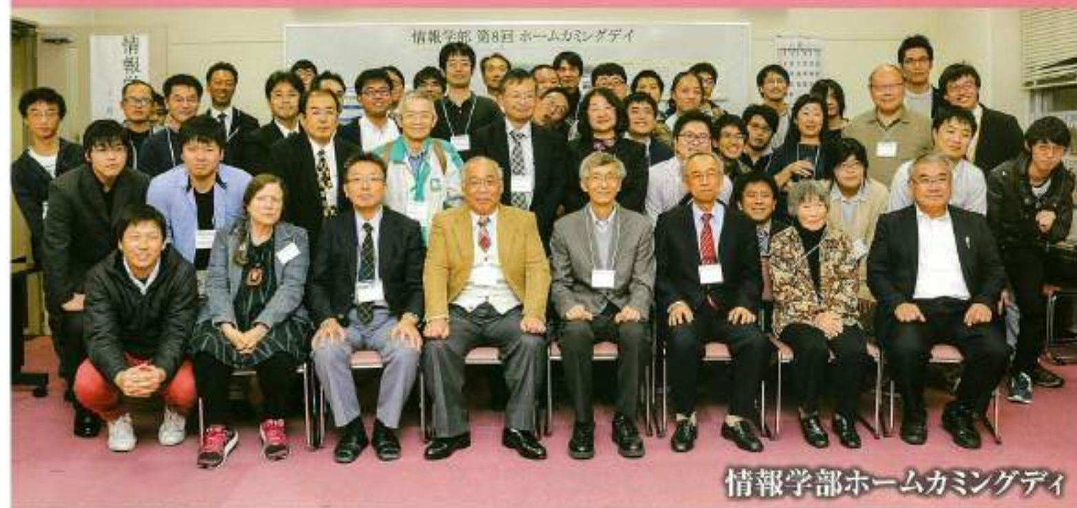
情報学部ホームカミングデー