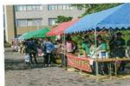
模擬店にもぎわっています