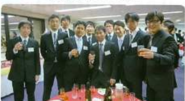
みんなで乾杯！（日星電気（株））