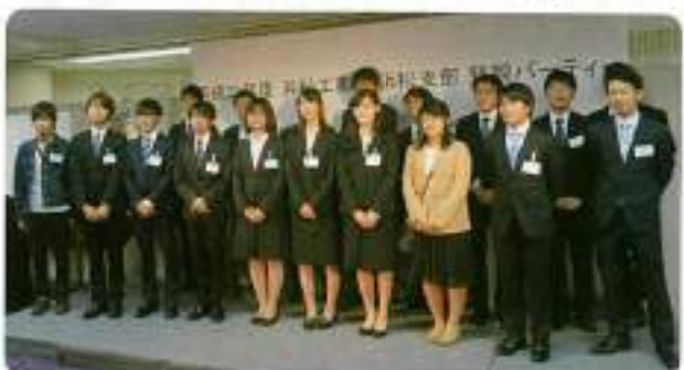
20歳代の沢山の皆さんが参加してくれました