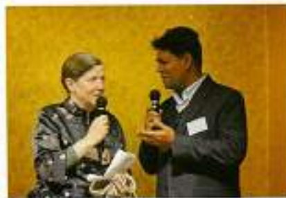
交互に通訳しちゃいました。