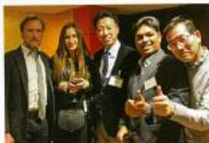
国際色豊かなパーティーでした