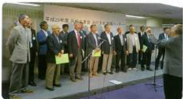
歌声も高らかな佐晴グリークラブの皆様