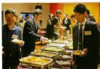
お料理・お酒も最高！

アルプスの少女ハイジなどのアニメも、見方を変えると実は深いメッセージがあり、考えるのではなく「感じる」ということの大切さ、面白さがあることを教えていただきました。先生のご講演を聞きたくて参加いただいた方もおり、非常に盛り上がりました。