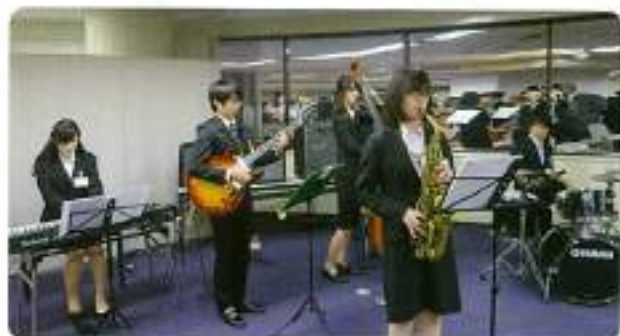
Jazz Phenomena の皆様 素晴らしい演奏をありがとうございました。

浜松支部総会、記念講演会に続き、懇親パーティーがプレスタワー7階「静岡新聞ミーティングルーム」で開催されました。若い会員にたくさん参加していただくように、各企業幹事や学校関係者にも協力して声かけをお願いし、また、会費を5,000円、20歳代を無料で招待することによって参加しやすくしました。ここ数年この方法を続ける中で、学生や若い会員が目立つようになりましたが、さらに、懇親パーティーの中で若い会員を紹介していることで、来年の参加も増やしたいと考えています。パーティーでは、静岡大学Jazzバンド「Jazz phenomena」に演奏いただき、若者向きの音楽に包まれたひとときを楽しむことができました。今回、参加できなかった皆様も是非来年は参加してください。