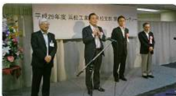
静岡、愛知、東京、嵐奈和の各支部からも 参加していただきました。