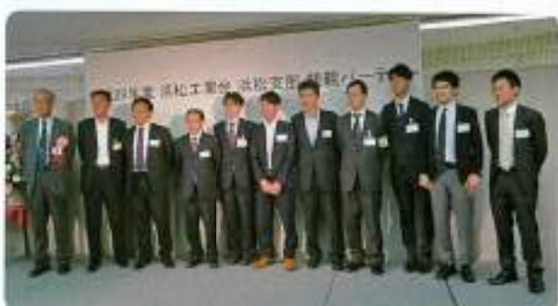
みんな集まれ！（ヤマハ（株））