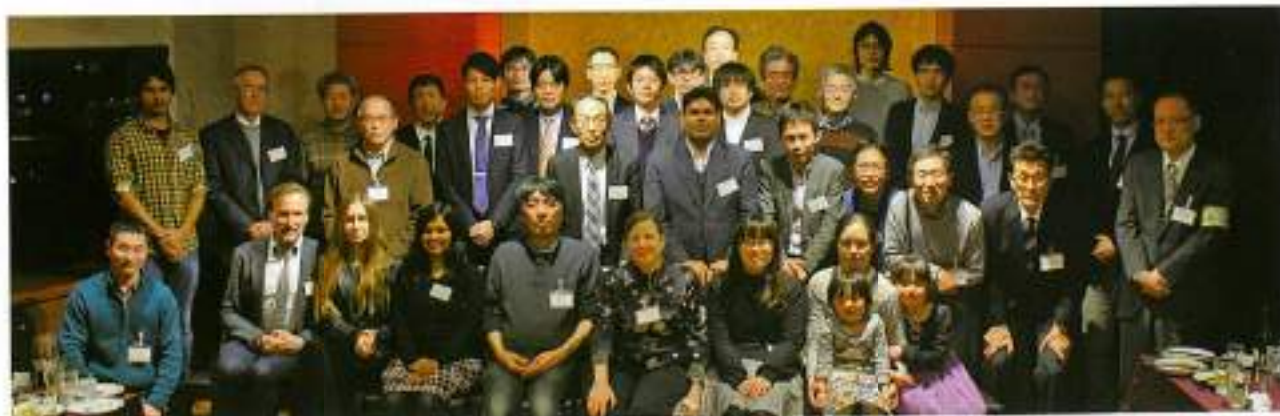
お約束の全体写真 顔の暗い方ごめんなさい