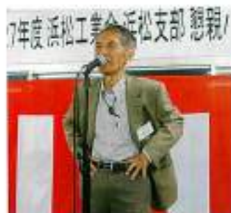
団長同好会近況報告