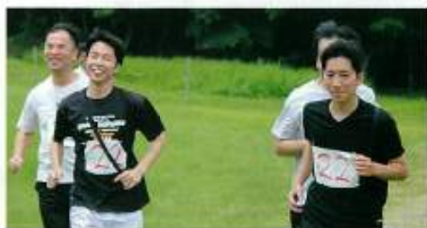
浜松支部混成チーム