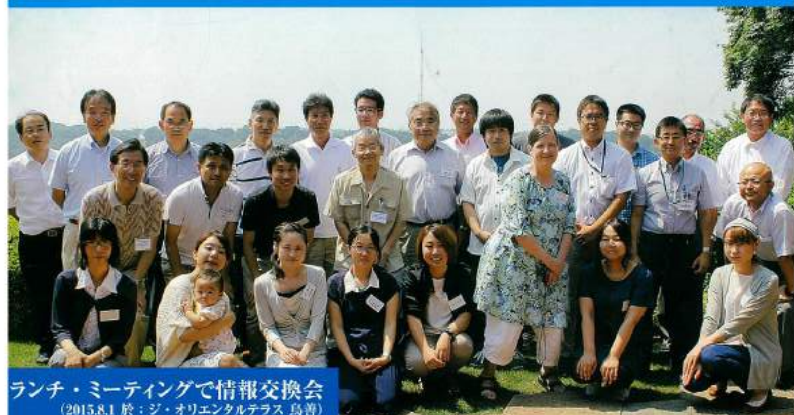
ランチ・ミーティングで情報交換会 (2015.8.1 於：ジ・オリエンタルテラス 鳥善)