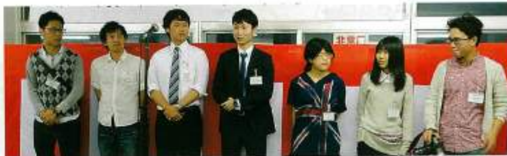
20歳代の皆さんも7名参加