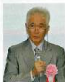
中村浜松工業会会長