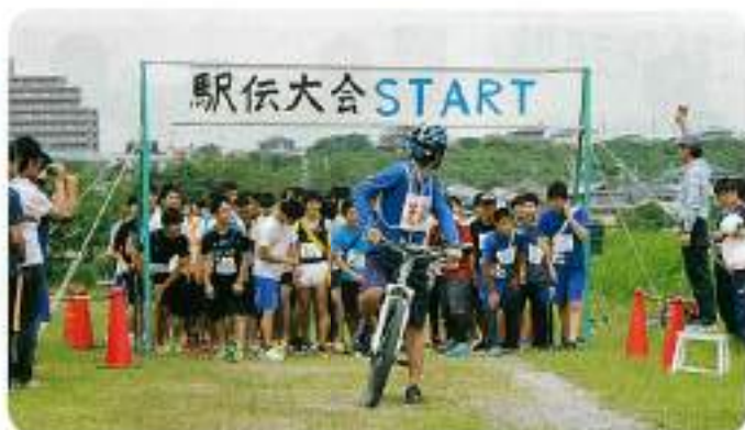
気合いを入れて一斉にダッシュ!

1チームは23人で構成され1区は2人、2 区～8区は3人がひと組になって走ります。今 年は全部で25チームが参加し健脚を競いま した。