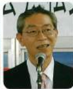
高松附属図書館長