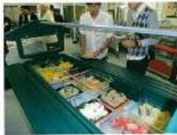
おいしい料理に舌鼓