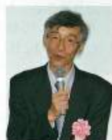
酒井情報学研究科長