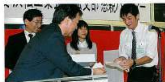
お楽しみ プレゼント コーナー

当日参加者をお願いしたアンケートの結果を紹介します。総会に初めて参加された方が37%いらっしゃいました。この方々に来年もまた参加していただけるような支部総会を企画したいと思います。