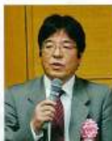
佐古工学研究科長