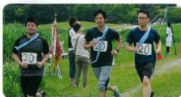
ヤマハ発動機チーム