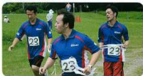
スズキ佐鳴会チーム