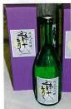
純米大吟醸「静大育ち」

最後に、支部総会、講演会、そして懇親パーティーの準備、運営に協力して下さった常任幹事や企業幹事の皆さんに感謝いたします。