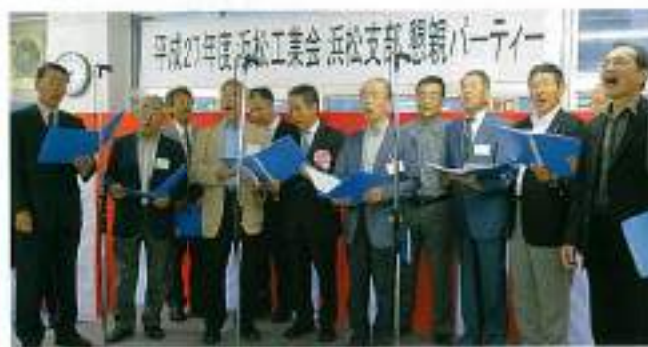
【佐鳴グリークラブ】の合唱披露