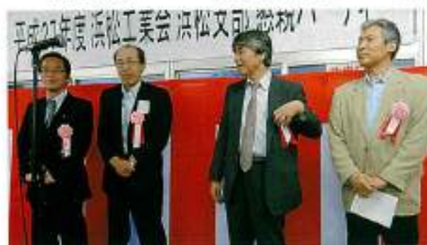
静岡、愛知、阪京和、東京の各支部長による近況報告